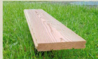
・床材…スギ(30×180×2,000) ・価格:4,500円/㎡