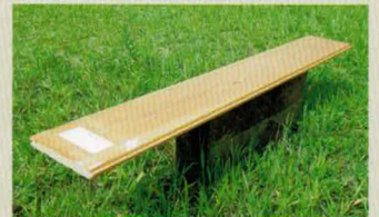
・床材…スギ(15×150×2,000) ・価格:5,000円/㎡